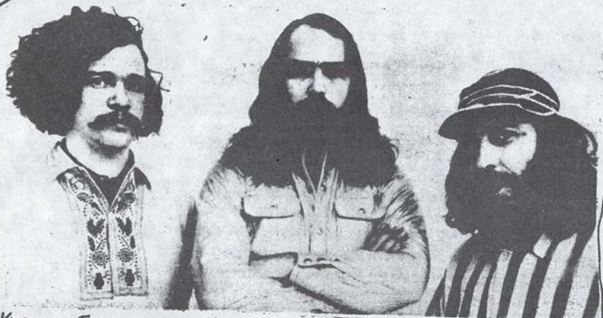
Kuvassa Fugs, perustajajäsenet.

FUGS IN LP: T -65: THE FUGS FIRST ALBUM, -66: THE FUGS 68: VIRGIN FUGS, TENDERNESS JUNCTION, IT CRAWLED INTO MY HAND, HONEST -69: THE BELLE OF AVENUE