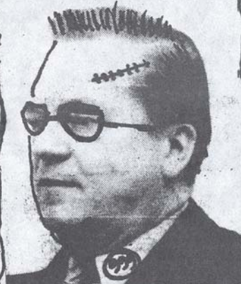
KITARAVIRTOOSSI JÄNÖ HAASTATTELUHETKELLÄ

NO SIIN SE SIT OLI OLIS SE VOINO OLLA PITEMPIKIN, MUTTA EI SIT KAIKKEE JAKSANU KIRJOITAA TOTTAKI ENS NÜMEROSSA ON TAA JOTAIN KATASTROFISTA-I.P. -LOPPU-