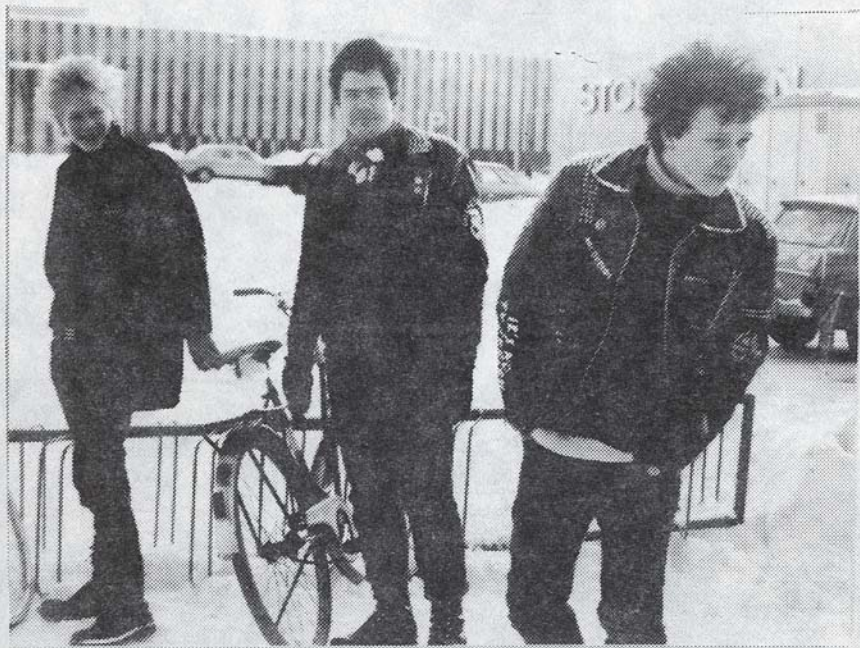
VASEMMALTA: ZUGI, IP, PP